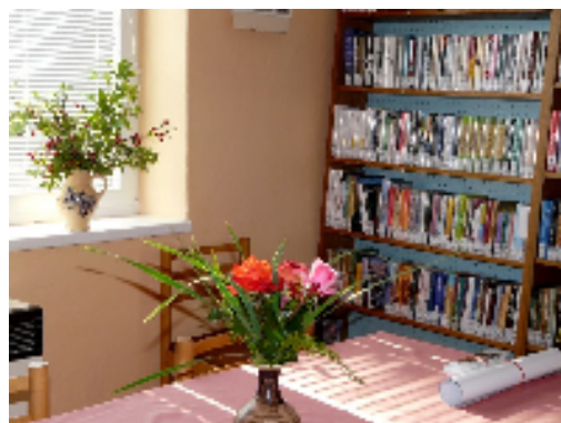
Místní knihovna Cejle

I malé obecní knihovny se mění, jejich knihovní fond se automatizuje, prostředí se postupně stává přívětivější a knihovníci aktivnější ve více činnostech. Na interiérové prostředí knihovny se stále zvyšují nároky, proto bychom měli péči o knihovnu věnovat patřičnou pozornost (pravidelný úklid, výzdoba, nábytek,...) tak, abychom se za ni nemuseli stydět a čtenáři u nás rádi trávili volné chvíle.