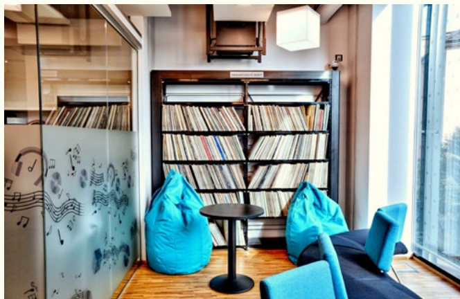
Krajská knihovna Vysočiny v Havlíčkově Brodě