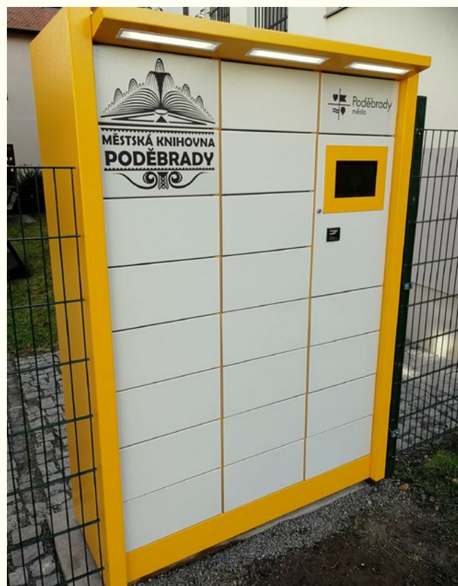
Městská knihovna Poděbrady