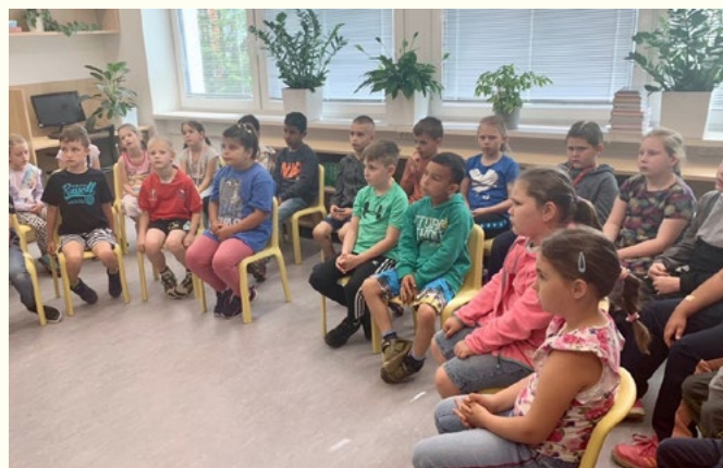
Městská knihovna Hanušovice

Knihovna podle svých možností a velikosti spolupracuje se školou/školským zařízením na rozvoji čtenářské, informační, mediální, digitální gramotnosti a usiluje o propojování neformálního a formálního vzdělávání dle školního vzdělávacího programu, například: