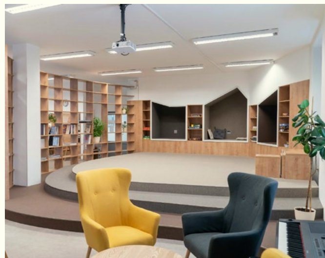
Městská knihovna Kyjov

Počet pracovníků v každé knihovně je ovlivňován řadou faktorů, např. délkou provozní doby pro veřejnost, rozsahem knihovního fondu a jeho uspořádáním, počtem budov nebo poboček knihovny, složitostí organizační struktury, šířkou služeb a stupněm jejich využívání, počtem uživatelů a nutností zaměstnávat specialisty (např. na lektorskou a přednáškovou činnost, práci s dětmi a mládeží, komunikaci s veřejností, IT technologie a další). Počet pracovníků se zvyšuje, pokud knihovna rozšiřuje svou činnost pořádáním kulturních, vzdělávacích a komunitních aktivit.