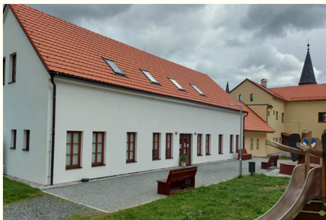
Městská knihovna Spálené Poříčí

Knihovny poskytují služby všem uživatelům na principu rovnosti s omezeními vyplývajícími z právních předpisů.