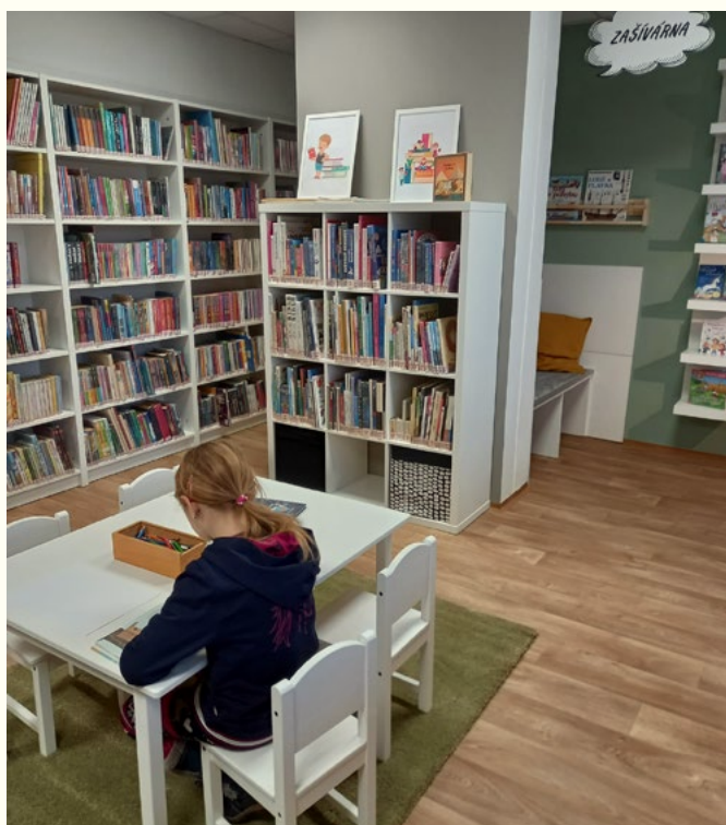
Městská knihovna Velké Opatovice

(Směrnice IFLA: Služby veřejných knihoven, článek 3.8.2)