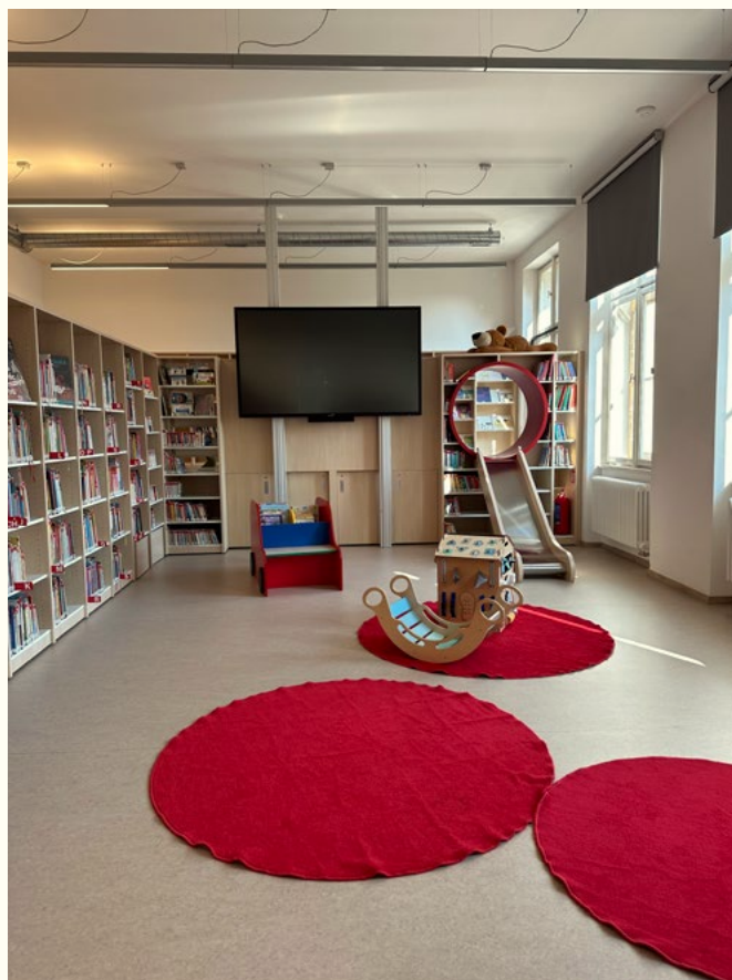
Knihovna Kutná Hora