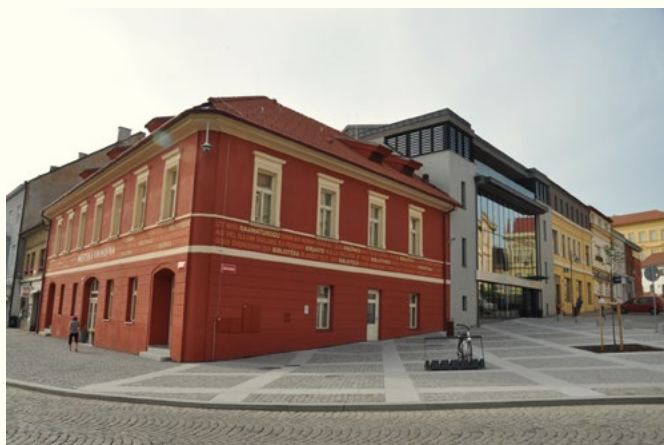
Městská knihovna Rakovník