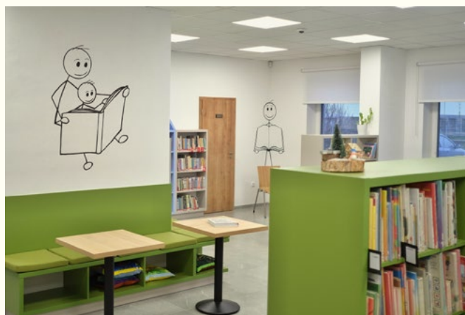
Školní knihovna Ždírec na Doubravou

(Směrnice IFLA: Služby veřejných knihoven, článek 3.4.8)