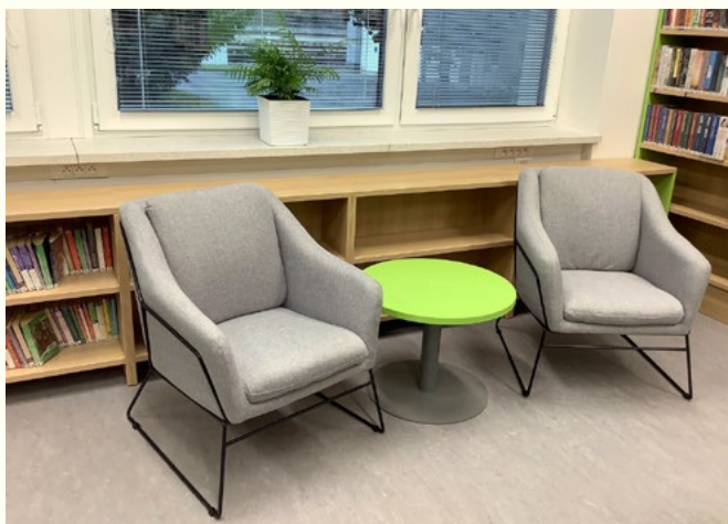
Městská knihovna Hanušovice

„Optimální přístup ke knihovnickým službám vyžaduje, aby knihovna byla otevřena v době maximálně vyhovující těm, kteří žijí, pracují a studují v místě jejího působení.“