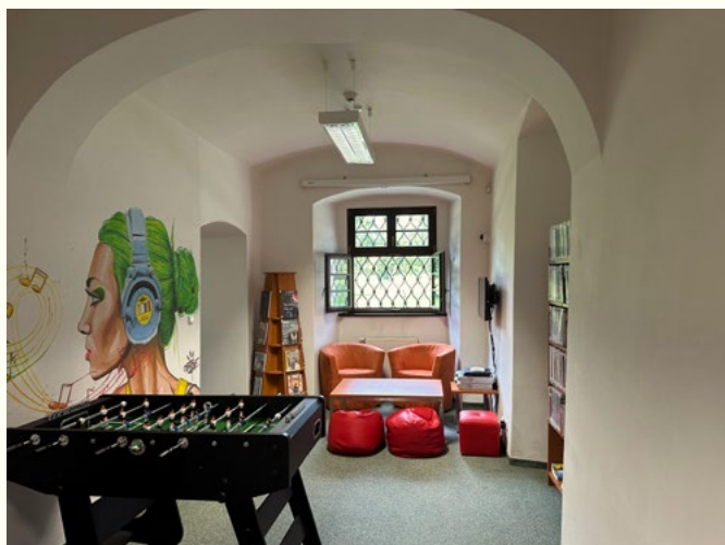
Městská knihovna Ostrov

Knihovna nabízí studijní místa 17 pro dospělé, děti a mládež, kde mohou uživatelé pracovat s knihovními dokumenty a informačními zdroji, a to individuálně nebo ve skupině. Tam, kde to místní podmínky umožní, je vhodné vytvářet čítárny, individuální a týmové studovny a místa pro soustředěné studium.