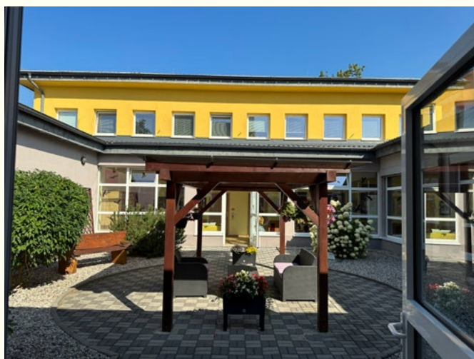
Městská knihovna Litvínov

Indikátor: Knihovna má k dispozici nejméně 60 m 2 na 1 000 obyvatel obce nebo spádové oblasti 13 . V obcích do 1 000 obyvatel se tento indikátor použije v přiměřeném rozsahu tak, aby byly zajištěny všechny funkce knihovny.