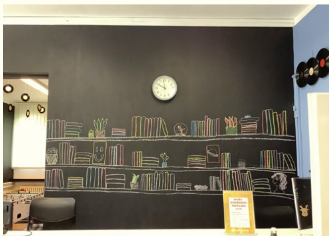
Městská knihovna Havířov

(Směrnice IFLA: Služby veřejných knihoven, článek 3.8.2)