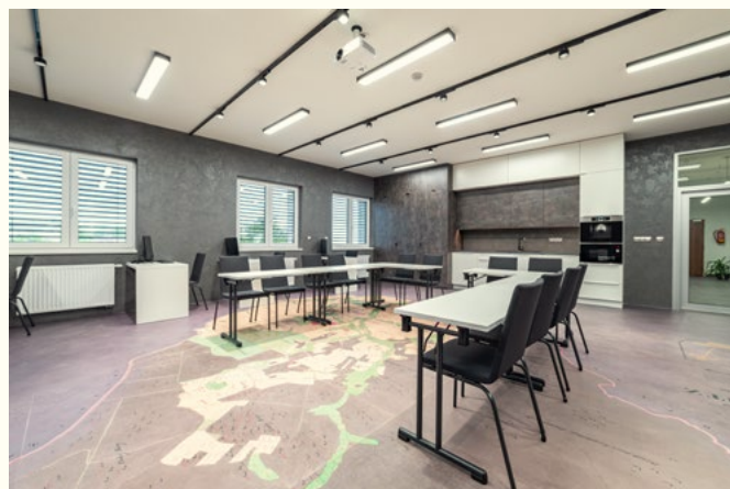
Místní knihovna Halenkovice