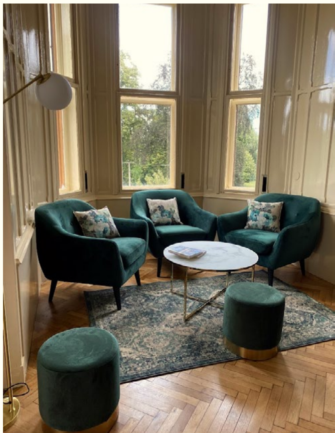
Obecní knihovna Svitávka

„Knihovnické služby mají být poskytovány v místě, které je maximálně využíváno, které je centrem života populace, je výhodné pro obyvatele obce. Pokud je to možné, mají být poblíž dopravních uzlů, v blízkosti center života komunity, např. obchodů, nákupních center, kulturních podniků.