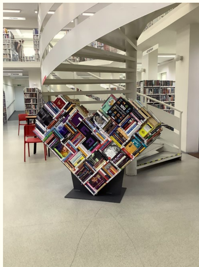
Městská knihovna Tábor